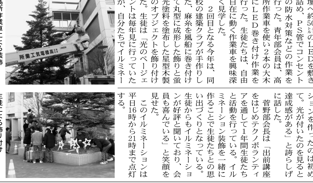
高所作業車による装飾